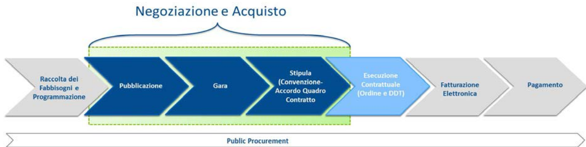
Figura 1: fasi del processo di public procurement