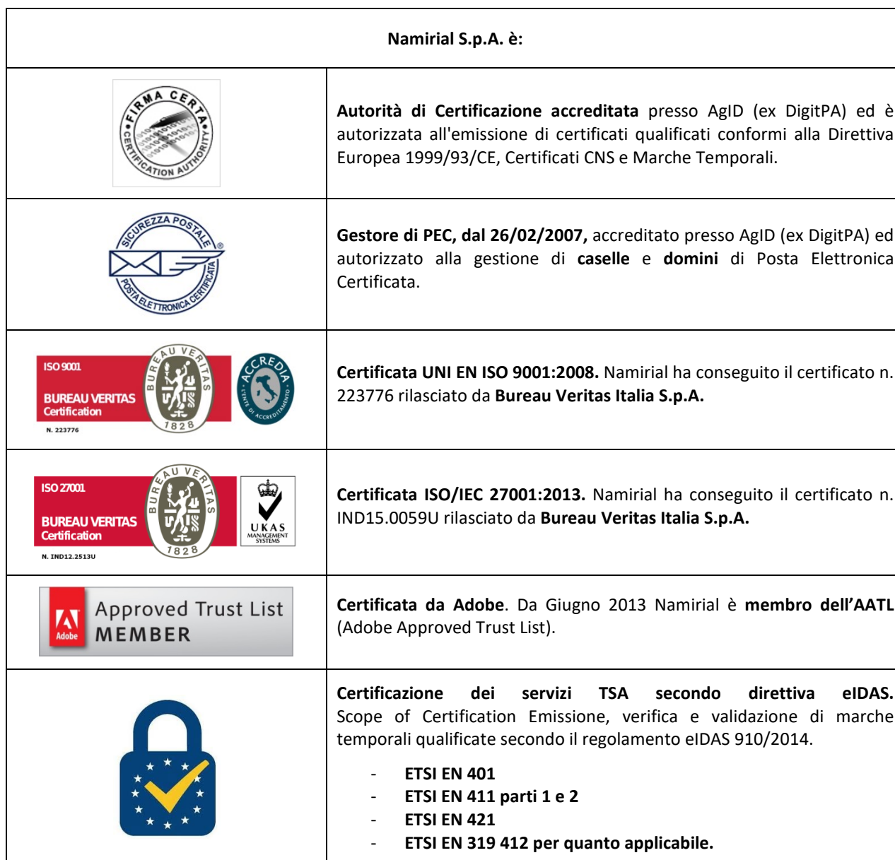
Tabella 4 - Certificazioni dei Gestore